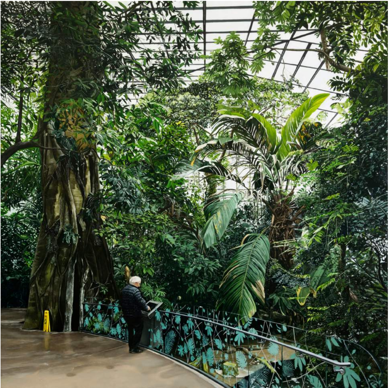
Au Biodôme, 2019 Huile sur toile 150 × 150 cm Courtesy Galerie Les filles du calvaire