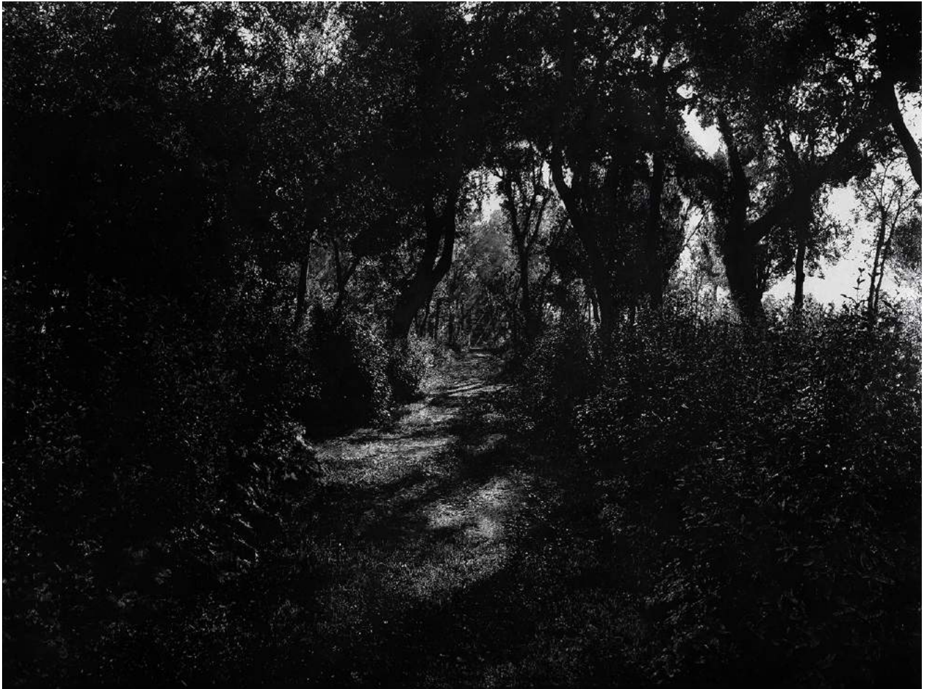
Le Bosco, 2020 Fusain sur toile 300 x 400 cm