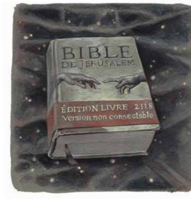
Bible de Jérusalem, édition 2118, version non connectable, 20,7 x 19,7 cm, gouache sur papier Arches, 2017

Sortie d'une monographie en janvier 2018. Seconde Lumière , 240 pages.