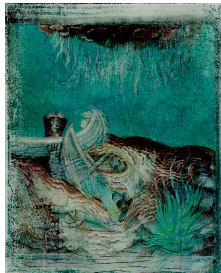
Le Naufrage, transfert wet dessin sur papier, 21 x 17 cm, 2017

Exposition personnelle du 7 juin au 21 juillet 2018, Edmond Galerie, Haubachstraße 17/19, Berlin