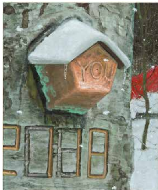
Witch Watch, huile sur toile, 46 x 38 cm, 2017