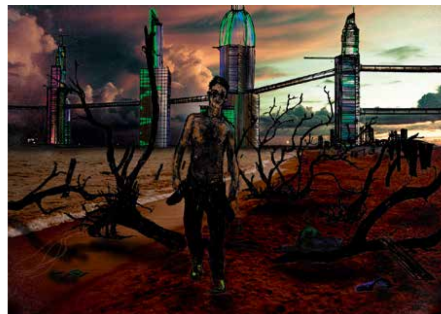
Le futur de qui?, crayon et mixed media sur papier A3, 2017

La confirmation de l'existence des ondes gravitationnelles, les prix Nobel, etc. —